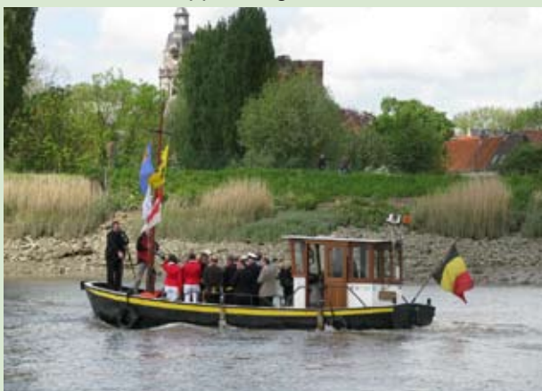
onder zeil: Wind, dus parade onder zeil