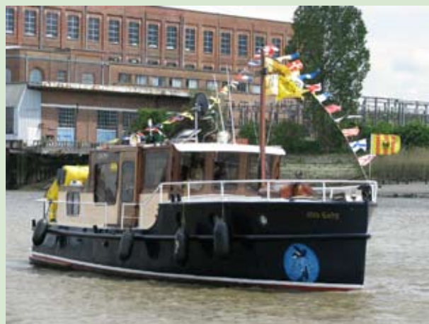
steiger rupelmonde: Ja, hier ging het allemaal om: de nieuwe steiger!