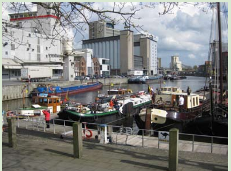
Zo lagen onze schepen er bij