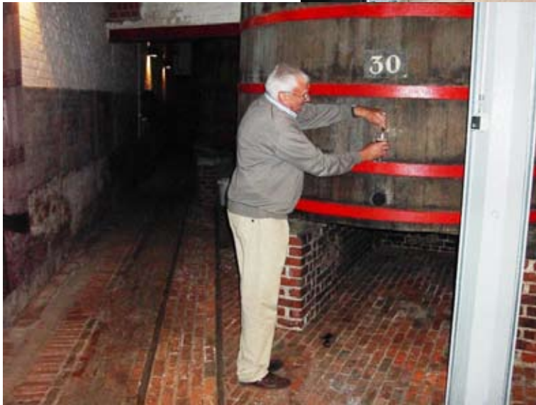
brouwerij rodensch: Een zicht op de ketels