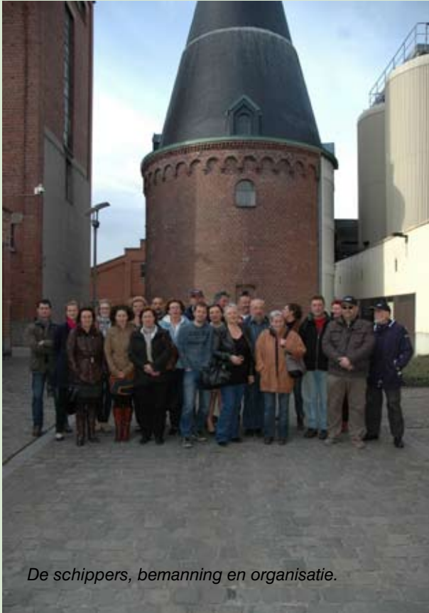
De schippers, bemanning en organisatie.

Gent is een stad naar m'n hart. Ik voel thuis me in de gemoedelijke sfeer die er heerst, de pleintjes, marktjes, en vooral... het smakelijke dialect dat je er overal hoort. Na een kleine twee weken is het echter tijd om richting Roeselare te vertrekken. De vereniging werd immers uitgenodigd voor het Openingsweekend van '150 Jaar Kanaal Roeselare-Leie', van 19 tot 22 april.