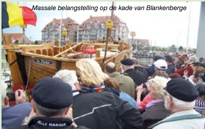
Massale belangstelling op de kade van Blankenberge

Nu werd de Sint Pieter te water gelaten met een volledig nieuwe eiken huid. Eik waarvan men de eigenschappen beter kan controleren en dat nog net iets makkelijker beschikbaar is dan het onzekere olmenhout.