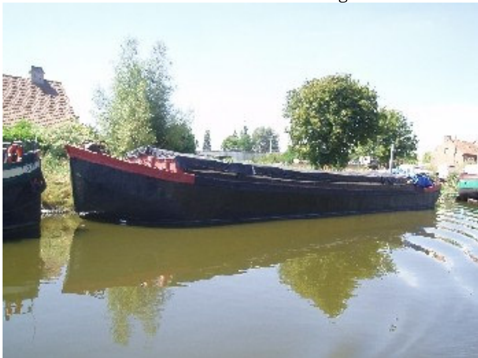
tijdens de restauratie in 2006

Dit sloopstypen dankt haar naam aan de typische tulpvormige boeg van de klippen en de bolle steven die kenmerkend is voor de aak. Dit schip is één van de weinige Belgische klippen die nog varen. De geschiedenis van dit schip en de aanpassingen geven een mooi beeld van de evoluties in de binnenvaart in de twintigste eeuw.