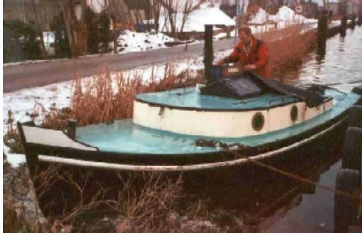
als 'Manus' in 2000

Tijdens de Nationale Sleepbootdagen in Vianen in 2004 werd de Greetje verkozen tot ' Opduwer van het jaar '.