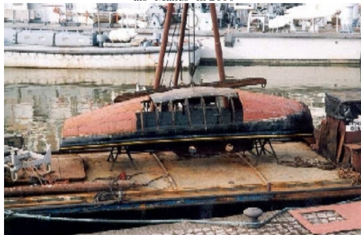
restauratie van het onderwaterschip in 2003