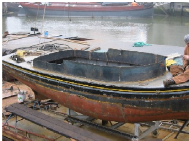
het plaatsen van de nieuwe opbouw in 2003