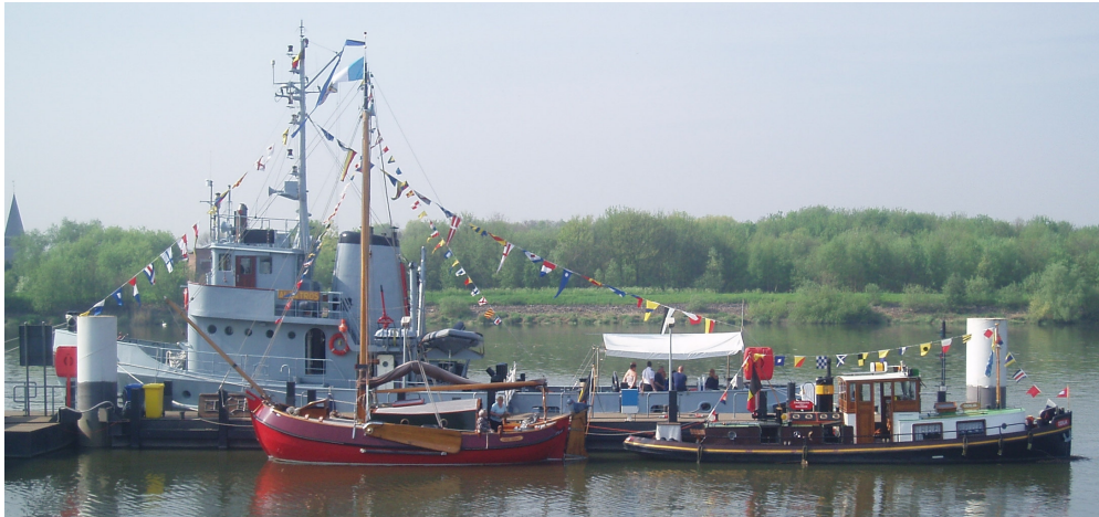
replica en historie samen op een evenement te Boom in 2006