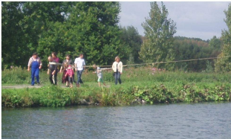
Het jagen van een vrachtschip door het publiek tijdens OMD 2007

Uw bestuur zet zich weer in om van Open Monumenten Dag 2008 aan het Zennegat weer een succes te maken. Het thema van deze 20° Open Monumenten dag is '20° eeuw'. We hopen dat zoveel mogelijk van onze leden het weekend van 14 september hun vaartuig zullen afmeren bij onze schepen die hun vaste ligplaats hebben aan het Zennegat om daar het publiek te laten kennis maken met ons varende erfgoed. Ook historische vaartuigen van andere verenigingen, sympathisanten enz zijn van harte welkom.