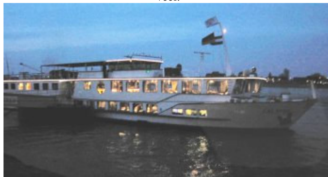
De "Calyso" is een bekende boot die zomers met gasten diverse bestemmingen langs Rijn en Moezel aandoet.

Bij mij zat het wel goed. Ik moet beter luisteren naar de vraag en niet te snel en te routineus antwoorden, ik maak daardoor soms wat stomme fouten. Dus.. blijven repeteren en op 1 maart naar de extra trainingsavond. Dan moet het gaan lukken. Examendatum zal ergens eind maart liggen. Mocht het allemaal lukken, dan moeten we nog een medische keuring ondergaan en een bewijs van goed gedrag bij de burgemeester halen.. Dat laatste lijkt me het moeilijkste..;-)) Daarna volgt dan nog de diploma uitreiking en de deelnemers mogen zich dan scharen bij die selecte groep van watersporters die hun RijnSportPatent gehaald hebben en dat zijn er niet veel.