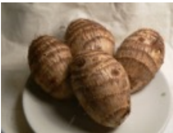
Taro- of pomtayerknollen